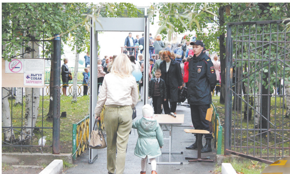
На торжественную линейку на территорию школы всем без исключения можно было попасть только через рамку металлоискателя

В Сургуте начался новый учебный год. В школы города одних только первоклассников пришло более шести тысяч человек. Накануне Дня солидарности в борьбе с терроризмом «НГ» встретился с представителями администрации города, руководителями силовых структур, чтобы поговорить о том, как сегодня обеспечивается безопасность наших детей.