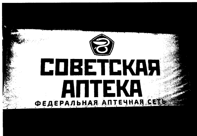
ФОТО (пункт 2)