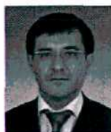
Селезнёв Валерий Сергеевич Комитет Государственной Думы ФС РФ по энергетике