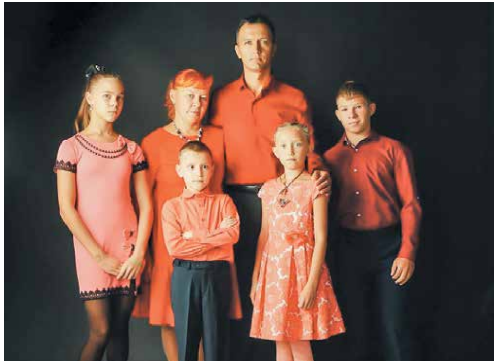
Семья Василенко.

Как во многих приёмных семьях, в нашей семье Василенко собралось