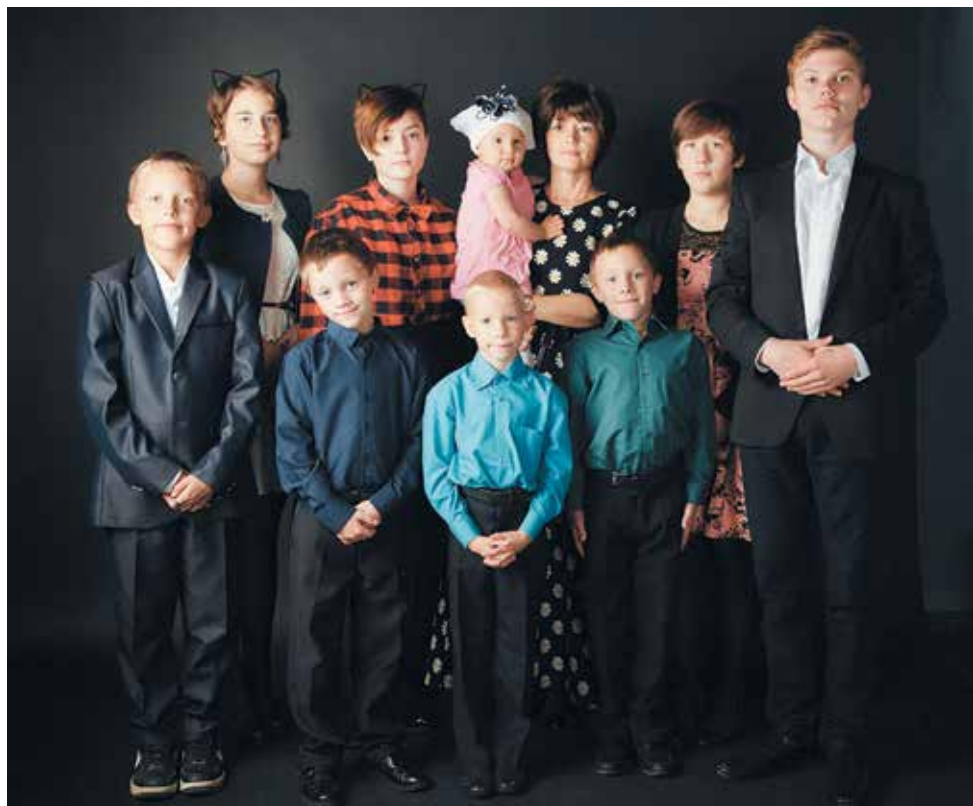
Семья Гатауллиных.

Владимир Владимирович и Эльмира Дамировна проводят много времени в общении с детьми, приводят в пример свое детство, рассказывают примеры из жизни других людей, учат детей молиться и обращаться к Богу с просьбами.