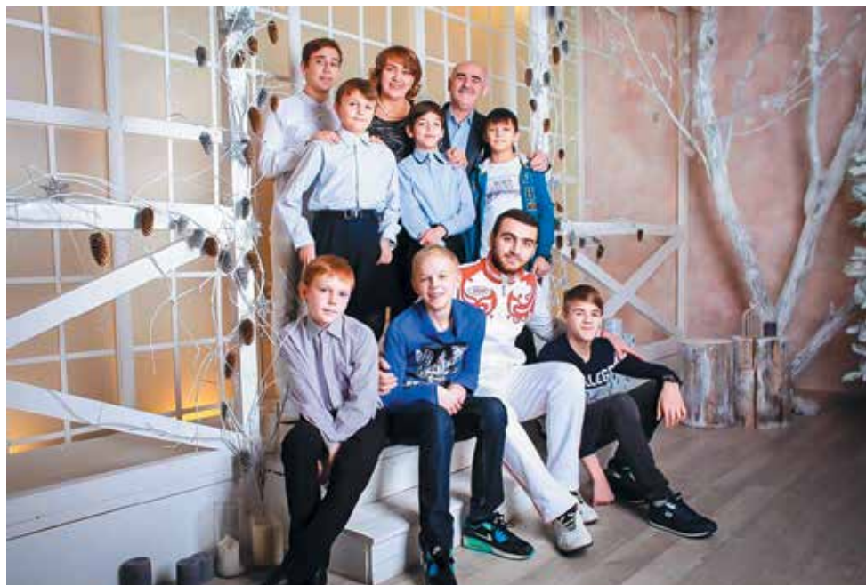
Семья Мехралиевых.

Традиций в нашей семье предостаточно, и нет препятствий для появления новых. И правда, зачем себя ограничивать в том, что приносит радость и пользу? Наша семейная традиция – проведение отпуска сразу всей семьёй. Любые праздники