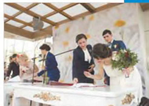
В реестр семейной жизни